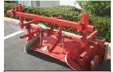
エイブル平高成形機にセットした状態