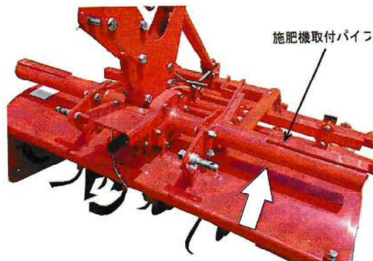
施肥機取付パイプ