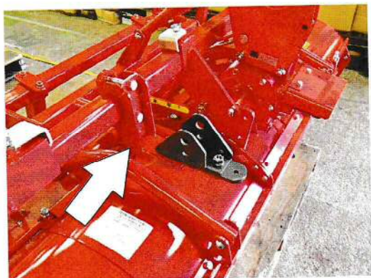
施肥機取付部品S（スタンダード）